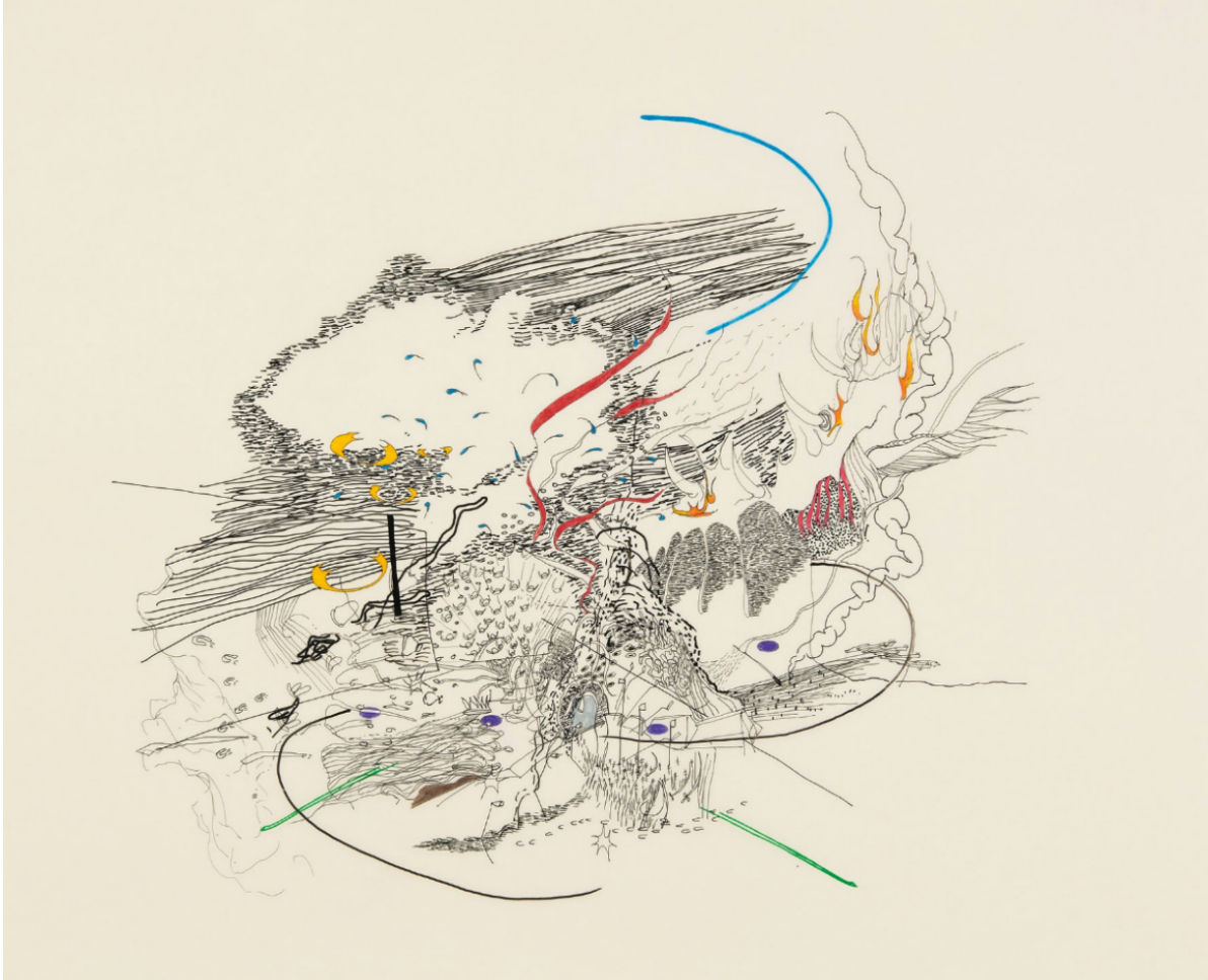
Julie Mehretu, Untitled , 2000.