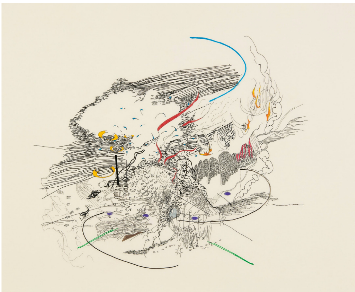
Julie Mehretu, Untitled , 2000.